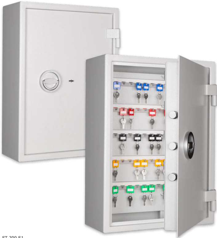
ST 200 S1 Lichtgrau • light grey Dekoration nicht im Lieferumfang enthalten • decoration not included in the delivery

Schlüsseltresor, S1 (EN 14450) und Stufe A (VDMA 24 992) Key cabinet, Security level S1 (EN 14450) and level A (VDMA 24 992)